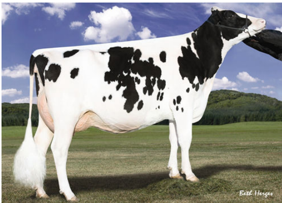
LARCREST CRIMSON FOURTH DAM